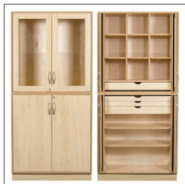
Sjöbergs Schrank 1, Glas-/ Birkentür, Textilien Vorschlag Art nr 38029