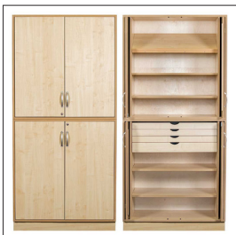
Sjöbergs Schrank 1, Birkentür, Werkräume Vorschlag Art nr 38009