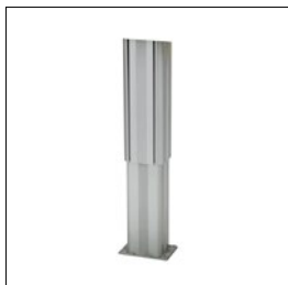
Säule für Werkstation, Höhenverstellbar Art. Nummer. 33275