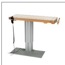
Sjöbergs Duplex 1 mit Bodenplatte