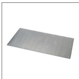
Bodenplatte für elektr. betriebene Säule Art. Nummer. 33342