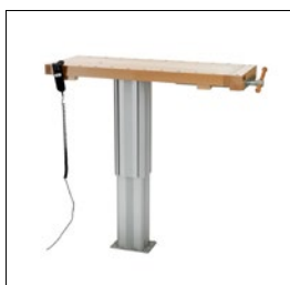
Sjöbergs Duplex 1 Art. Nummer. 33082