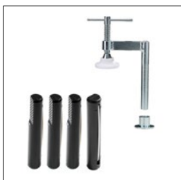
Bankhaken, rund/ Spannzwinge SB + Hülse Art. Nummer. 33290/33636