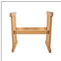
Sjöbergs Duplex Holzgestell für 1-Werkstation Art. Nummer. 33831