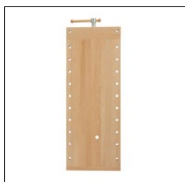
Sjöbergs Platte Duplex Art. Nummer. 33826