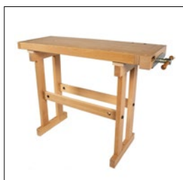
Sjöbergs Duplex mit Holzgestell Art. Nummer. 33084