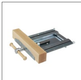
Vorderzange, Sjöbergs Original 1100