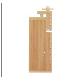
Sjöbergs Original 1100, Arbeitsplatte