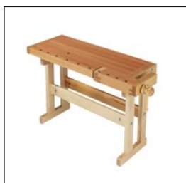
Sjöbergs Original 1100, 1-station, Höhe 850