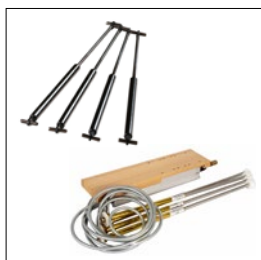
Gasfederung/Hydraulik-satz Art. Nummer. 33142/33795