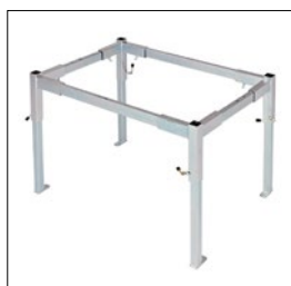
Stahlgestell, 4-station Art. Nummer. 33198