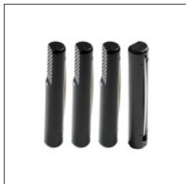
Bankhaken, rund Art. Nummer. 33290