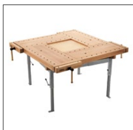
Sjöbergs Schule-4, höhenverstellbar Stahlgestell Art. Nummer. 35014