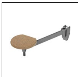
Frei schwingender Hocker Art. Nummer. 33200