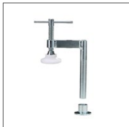
Spannzwingen SB + Hülse Art. Nummer. 33636