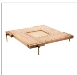
Sjöbergs Schule-4, Platte Art. Nummer. 33268