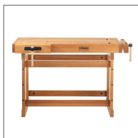
Sjöbergs Scandi 1425