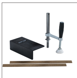
Zubehörsatz Sjöbergs Scandi