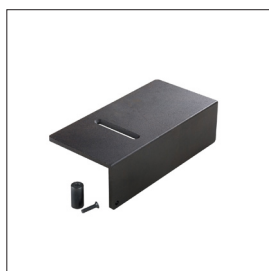
Universal Amboss, einstellbar