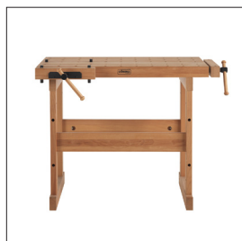
Sjöbergs MFB 1060

1230x700x100 mm 48 27/64 x27 9/16 x 3 15/16 in