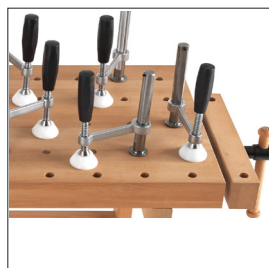
Sjöbergs MFB 1060