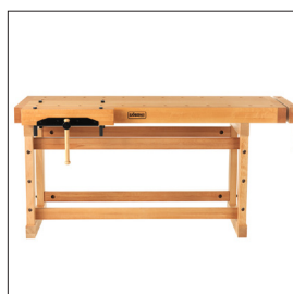
Sjöbergs Elite 2000 Art nr 33458

Bankhaken sind stets Teil des Lieferumfangs.