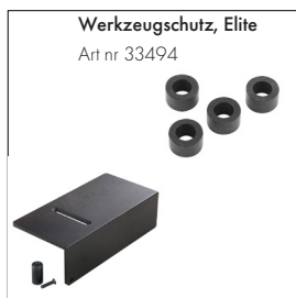
Werkzeugschutz, Elite Art nr 33494