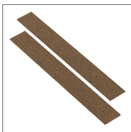
Schutzbacken Art nr 33382