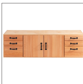
Sjöbergs SM04 Art nr 33464