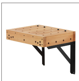
Sjöbergs Clamping Platform Art nr 33467