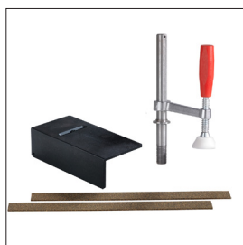
Zubehörsatz Sjöbergs Elite Art nr 33480