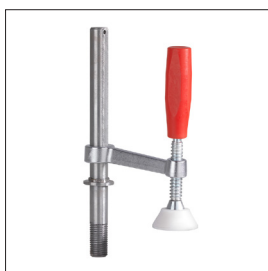
Spannswinge QSH Art nr 33635