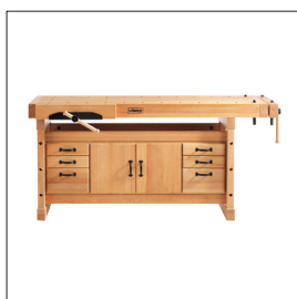
Sjöbergs Elite 2000 + SM04 Art nr 35003